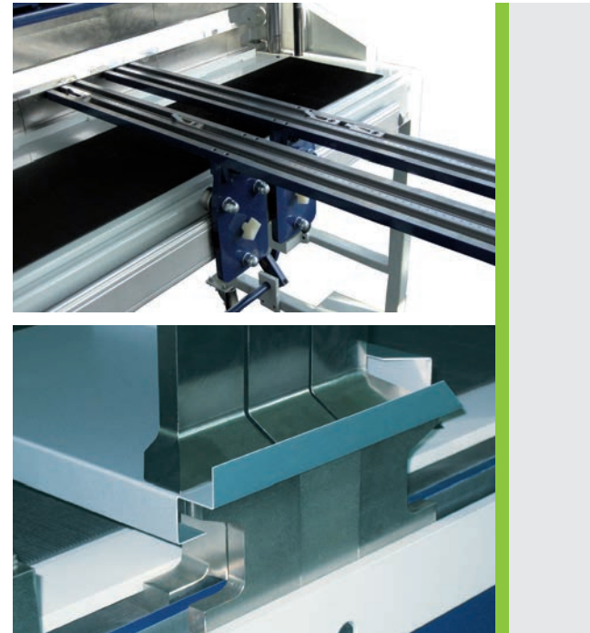
Variable Anschläge sorgen für Präzision (Bild oben). Eröffnen Möglichkeiten: Segmentierte Werkzeuge an allen drei Wangen (Bild unten)

Die Segmentabkantmaschine gehört zur Standardausstattung jeder blechverarbeitenden Werkstatt – eine hochwertige ASK II von Schröder ist hier die Anschaffung fürs Leben. Robust genug für den harten Arbeitsalltag, einfach in der Handhabung und flexibel in der Anwendung.