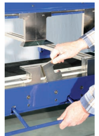
Patentierte Exzenter-Schnellklemmung für Ober- und Biegewange