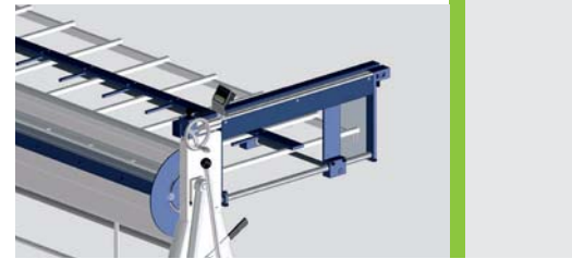
Optional: manueller Hinteranschlag von vorne verstellbar mit Digitalanzeige incl. Auflagetisch

Die Hand-Schwenkbiegemaschine AK ist die Perfektion für die täglichen Anforderungen in kleinen und mittleren Betrieben. Die manuelle Schwenkbiegemaschine von Schröder wird seit Jahrzehnten in Klempner-, Dachdecker- und Blechbearbeitungsbetrieben im In- und Ausland eingesetzt.