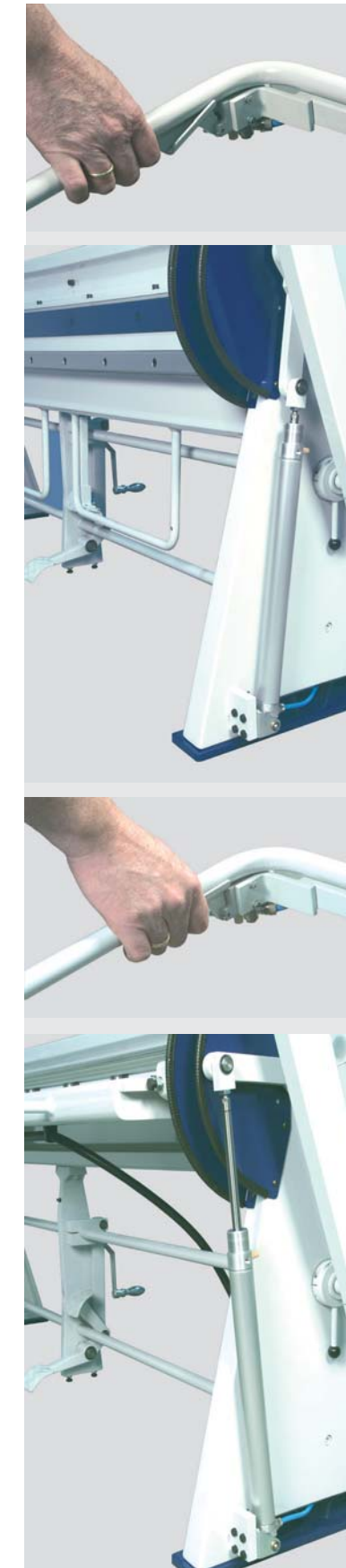
Die pneumatische Biegehilfe wird über einen Fingerhebel am Biegewangenbügel gesteuert. Der Pneumatikzylinder unterstützt den Bediener beim Biegen des Werkstücks. Sie benötigen nur eine Druckluftzufuhr.