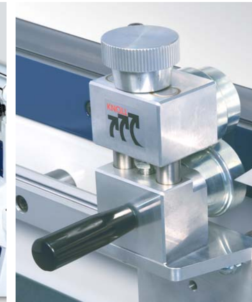
Mit dem Profilier- und Zudrückkopf wird das Werkstück in die gewünschte Form gebracht