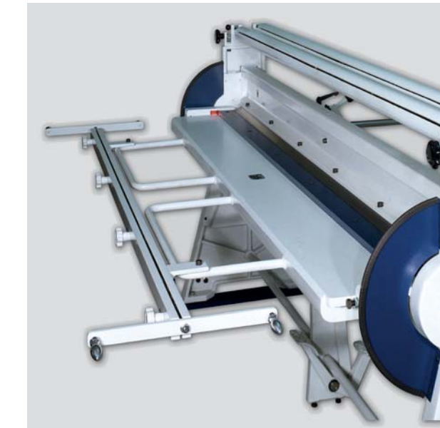
Verstellbare Wulsteinrichtung ohne Wulststab und Windeisen

Die Handschwenkbiegemaschine AK kann bis zu 1,5 mm starke Bleche mühelos von Hand biegen. Darüber hinaus bietet sie dem Bediener zahlreiche Ausstattungsmöglichkeiten.