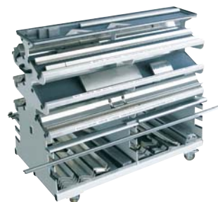
Immer aufgeräumt: Nutzen Sie unseren praktischen Werkzeugwagen als optionale Sonderausstattung.