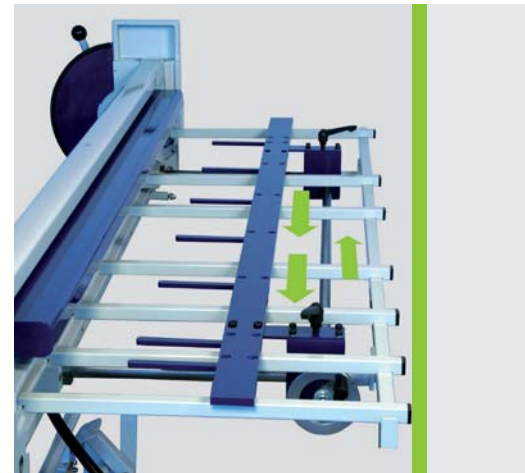
Der Auflagetisch incl. Hinteranschlag mit seinen verschieb- und entfernbaren Auflageleisten sorgt für sehr variable Arbeitsmöglichkeiten.