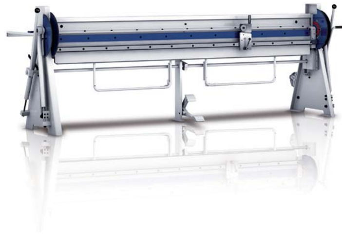
Ergonomische Arbeitshöhe 930 mm und optimierte Fußhebelposition

Die manuelle Schwenkbiegemaschine Modell AK ist die klassische Werkstattmaschine für den täglichen Einsatz in kleinen und mittleren Betrieben – einfach unverwüstlich und bedienungsfreundlich.